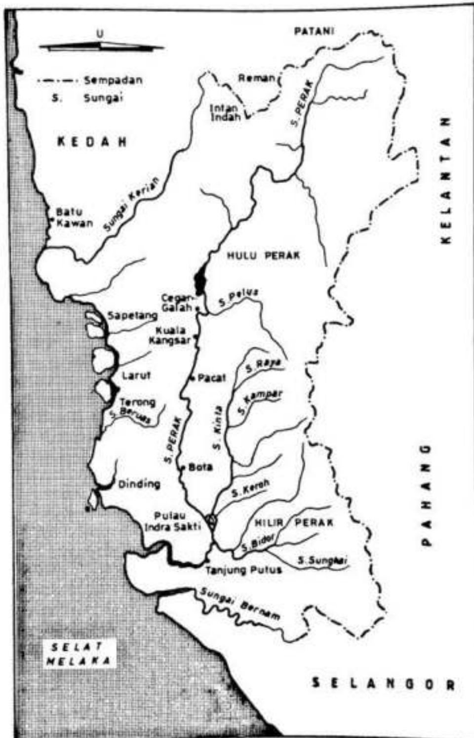
Peta 1: Kawasan Hulu dan Hilir Perak Dalam Abad Ke-18