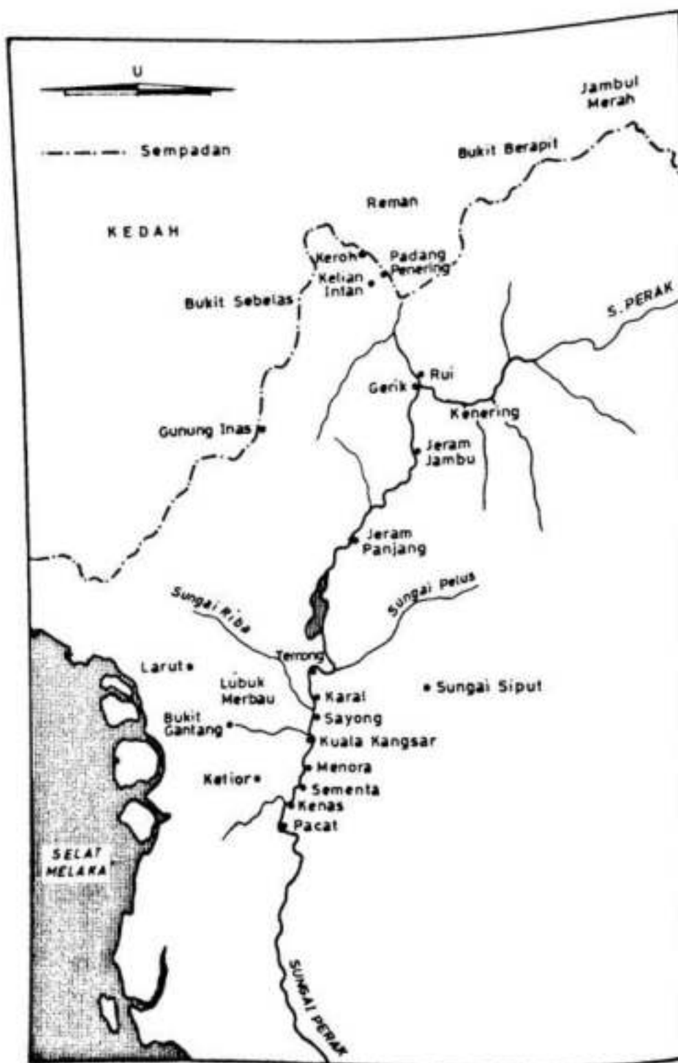
Peta 2: Kawasan utama melombong bijih di bahagian Hulu Perak pada abad ke-18. Menurut laporan Belanda tahun 1768.